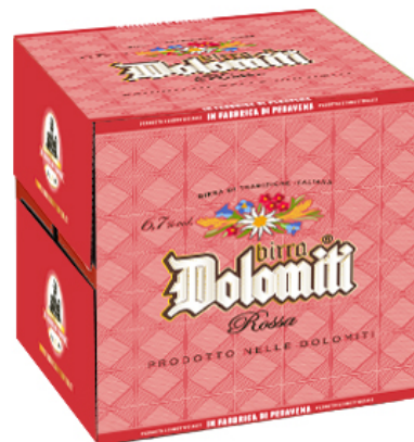
Imballo secondario cartone Codice EAN 8023400106600